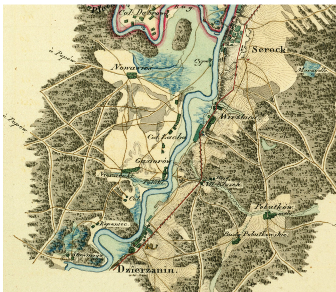
Łacha na mapie z I poł. XIX w

Osadnicy byli wyznania ewangelickiego-augsburskiego i w XIX-XX w. należeli do parafii w Pułtusk. Większość miała gospodarstwa od 15 do 25 mórg. W czasie budowy twierdzy w Serocku, w Łasze zbudowano szaniec przedmostowy. W 1807 r. był tu obóz wojsk bawarskich gen. Wrede i polskiej jazdy, zabezpieczający szaniec. Stąd oraz z Serocka 18 czerwca przeprowadzono atak na wojska rosyjskie w rejonie Nowej Wsi i Zator.