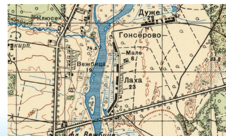
Mapa 1941 r.