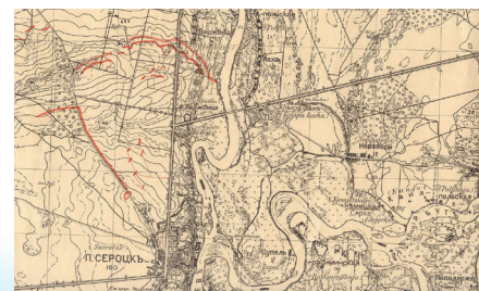
Mapa 1915 r.