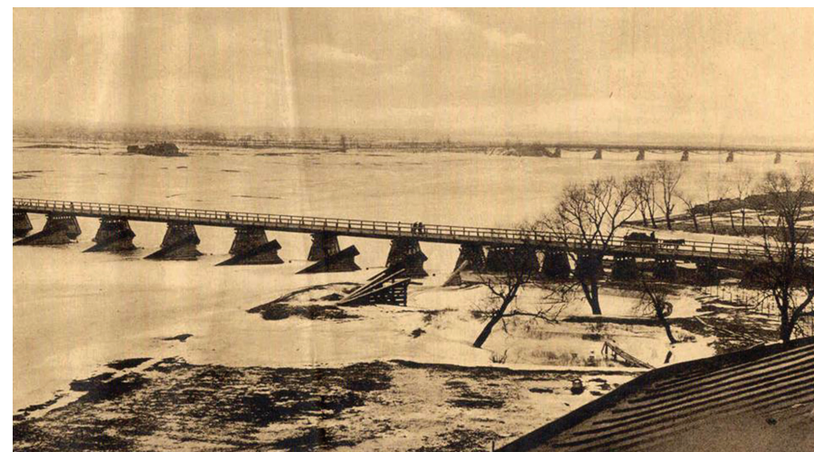
Most między Wierzbicą i Łachą w czasie I wojny światowej