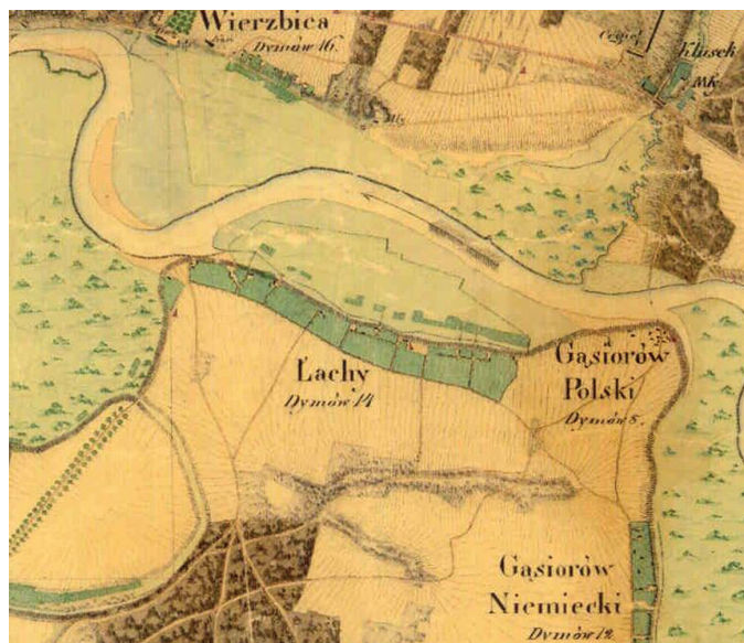
Fragment mapy z 1828 r.

Nazwa ma charakter topograficzny. Mogła funkcjonować dla tego terenu jeszcze przed powstaniem wsi, gdyż zgodnie ze słownikiem języka polskiego oznacza piaszczystą mielizną rzeczną, dawne koryto rzeki, częściowo wypełnione wodą, częściowo porośnięte zaroślami lub podmokłymi łąkami. W połowie XIX w. używano też nazwy w liczbie mnogiej Łachy lub Holendry. Nazwę mogli też nadać niemieccy koloniści, gdyż w języku niemieckim "lache" oznacza kałużę. Wieś powstała w II połowie XVIII w. Niemieccy koloniści zostali tu sprowadzeni przez właściciela dóbr Popowo, by zagospodarowali tereny podmokłe nad Narwią i przekształcili je w tereny rolnicze.